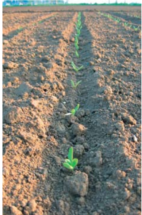
EPD technológiával kezelt vetőmag